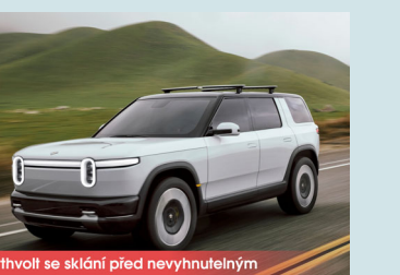
Northvolt se sklání před nevyhnutelným

Režim Donald Trumpa přináší novinky z automobilového průmyslu. Švédský výrobce akumulátorů Northvolt se sklání před nevyhnutelným, když se sklání před nevyhnutelným. Trumpovy hrozby cly se vracejí.