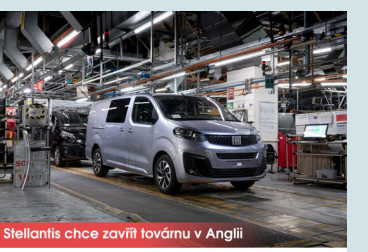
Stellantis chce zavřít továrnu v Anglii