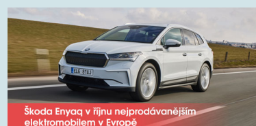
Škoda Enyaq v říjnu nejprodávanějším elektromobilem v Evropě

Klikněte zde a stáhněte si AutoTablet ve formě pdf, získáte ještě: